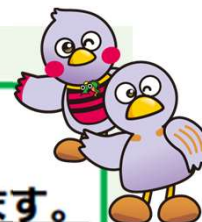
埼玉県 マスコット 「コバトン」 「さいたまっち」