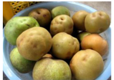
写真2 被害を受けたなし